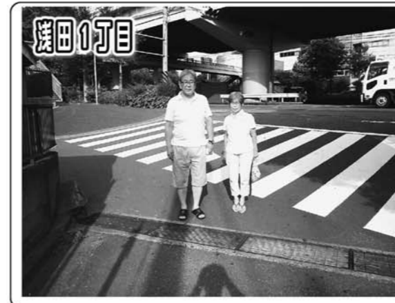
雨水の流れ込み防止のため集水設備の汚泥を除去