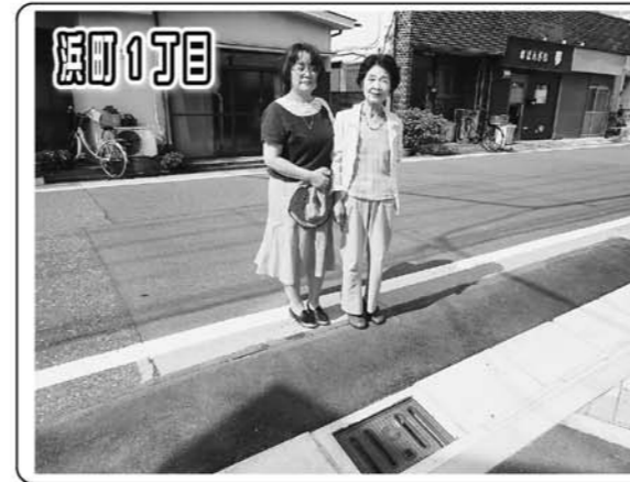
雨水対策として古くなった側溝を改修