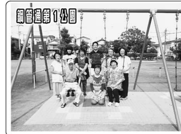
雨水がたまるブランコ下にプラスチック板を設置