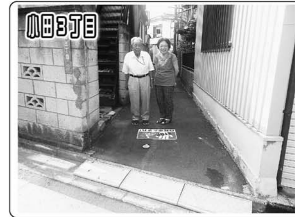
交通安全のため飛び出し防止のステッカーを設置